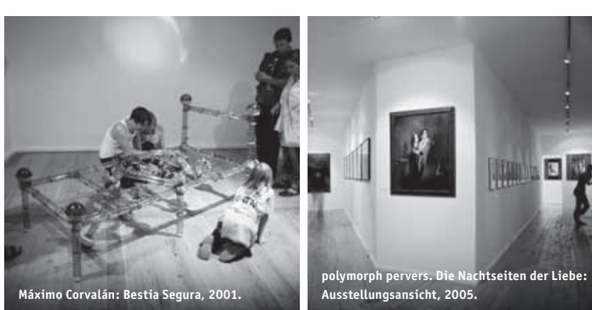
Máximo Corvalán: Bestia Segura, 2001.

polymorph pervers. Die Nachtseiten der Liebe: Ausstellungsansicht, 2005.