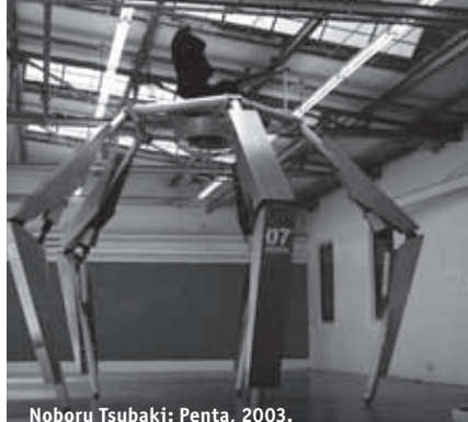
Noboru Tsubaki: Penta, 2003.