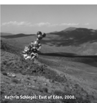
Kathrin Schlegel: East of Eden, 2008.