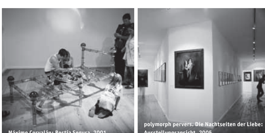
Máximo Corvalán: Bestia Segura, 2001.