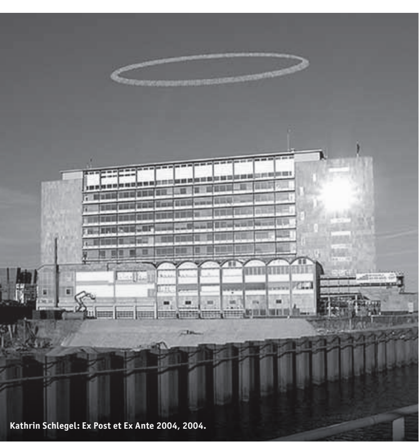
Kathrin Schlegel: Ex Post et Ex Ante 2004, 2004.