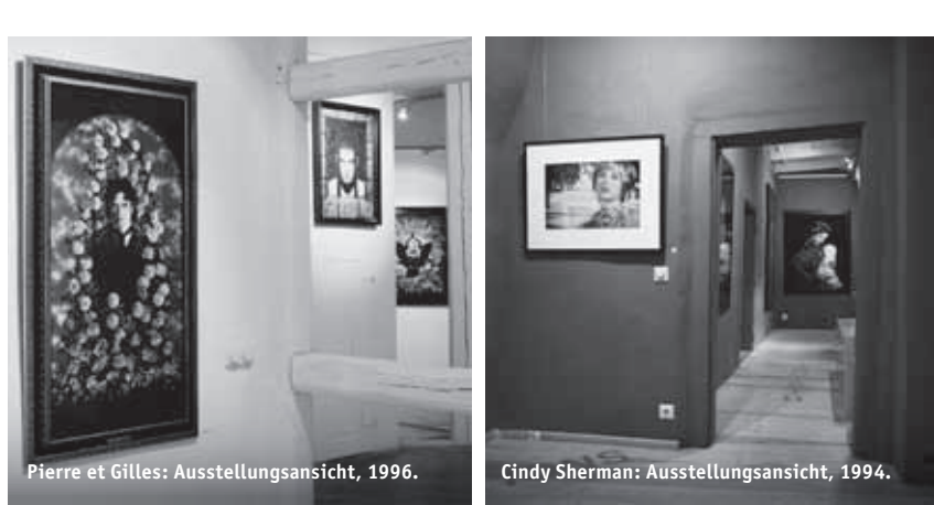
Pierre et Gilles: Ausstellungsansicht, 1996.