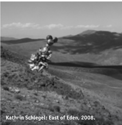
Kathrin Schlegel: East of Eden, 2008.