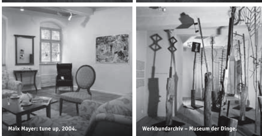
Maix Mayer: tune up, 2004.