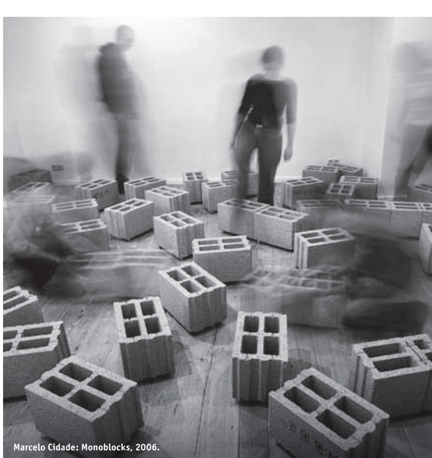
Marcelo Cidade: Monoblocks, 2006.