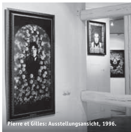
Pierre et Gilles: Ausstellungsansicht, 1996.