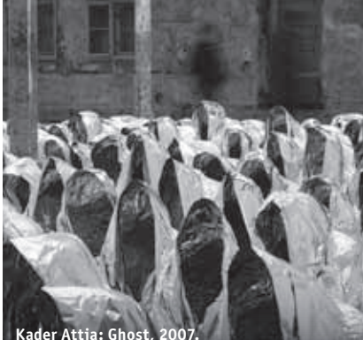
Kader Attia: Ghost, 2007.