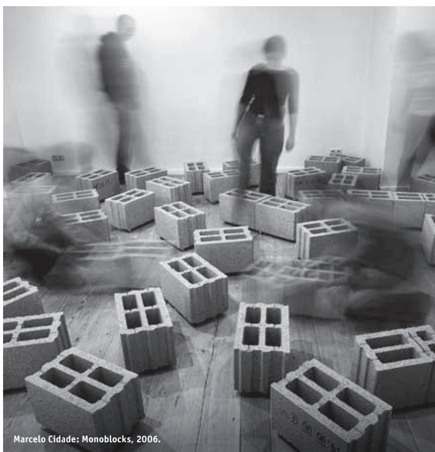
Marcelo Cidade: Monoblocks, 2006.