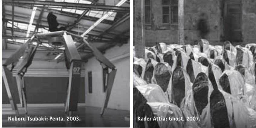
Noboru Tsubaki: Penta, 2003.