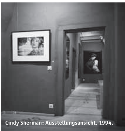
Cindy Sherman: Ausstellungsansicht, 1994.