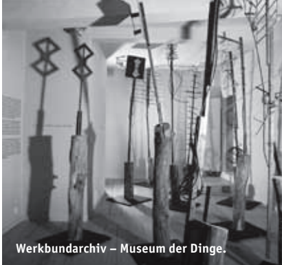
Werkbundarchiv – Museum der Dinge.