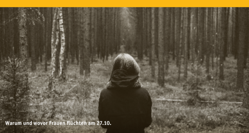
Warum und wovor Frauen flüchten am 27.10.

In der allgemeinen Wahrnehmung ist ein Flüchtling «der Andere». Jemand, der sein Land verlässt und zu «uns» kommt. Aber sind nicht auch «wir» auf der Flucht? Eine Flucht vor Krankheit, Alter, Tod? Auf der Flucht vor Dingen, die wir ablehnen? Und wohin fliehen wir? In den Urlaub? In eine andere Beziehung? In die Spiritualität? Zu Pegida? Wenn wir unseren eigenen Drang zur Fluchtbewegung erkennen, kommen wir der Wirklichkeit(=verneinung) auf die Spur. Wir können Wege finden, mit den abgelehnten Wirklichkeitselementen umzugehen. Unser Leben wird umfassender, wirklicher und vielleicht einfacher. Unsere Wahrnehmung und unser Handeln ändern sich. Auch gegenüber Flüchtlingen. Heinz-Jürgen Metzger ist Zenmeister und leitet die BuddhaWeg-Sangha. Als europäischer Koordinator der Zenpeacemaker, die Buddhismus und soziales Engagement verbinden, war er an der Leitung von sogenannten Retreats in der KZ-Gedenkstätte Auschwitz beteiligt. Seit 2001 führt er jährlich Meditationstage in der Gedenkstätte Buchenwald durch. Eintritt: 3 € | erm.: 2 € | Tafelpass: 1 €