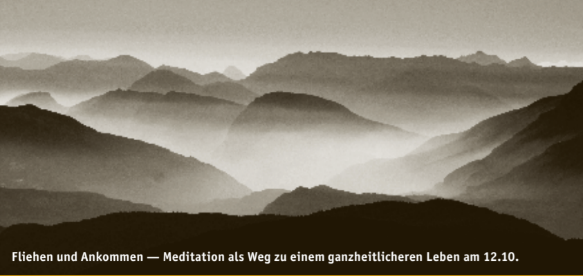
Fliehen und Ankommen — Meditation als Weg zu einem ganzheitlicheren Leben am 12.10.

Mo 12.10.2015 | 20:00 plus zur aktuellen Ausstellung