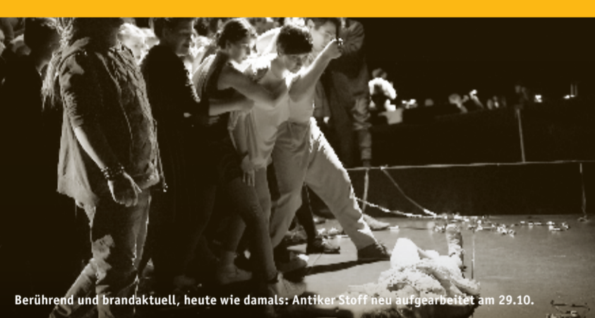
Berührend und brandaktuell, heute wie damals: Antiker Stoff neu aufgearbeitet am 29.10.

Menschen fliehen aus fernem Ländern vor Krieg und Terror. Auch in Weimar fliehen Menschen aus Wohnungen, sogar in der eigenen Nachbarschaft, eine Flucht vor Terror im Alltag und häuslicher Gewalt. 17.000 Frauen und Kinder suchten 2013 in deutschen Frauenhäusern Schutz vor einem gewalttätigen Partner und Vater, ungezählt derjenigen, die bei Verwandten oder Freunden unterschlüpfen. Erst recht nicht gezählt sind die, die gar nicht erst versuchen, einem von Gewalt dominierten Familiensystem zu entkommen, weil ihre Widerstandskraft nur zum täglichen Überleben reicht und der Gedanke an Freiheit Angst macht. Warum trennen sich Frauen nicht von gewalttätigen Partnern? Womit müssen sie rechnen, wenn sie es tun? Wie tickt ein Familiensystem, das von Brutalität in Worten und Taten geprägt ist? Welche Auswege gibt es? Drei Sozialpädagoginnen des Weimarer Frauenhauses arbeiten seit 25 Jahren für die Opfer häuslicher Gewalt. Sie sprechen mit Alexandra Janizewski über die kaum beachteten Fluchten gleich vor unserer Haustür. Eintritt: 3 € | erm.: 2 € | Tafelpass: 1 €