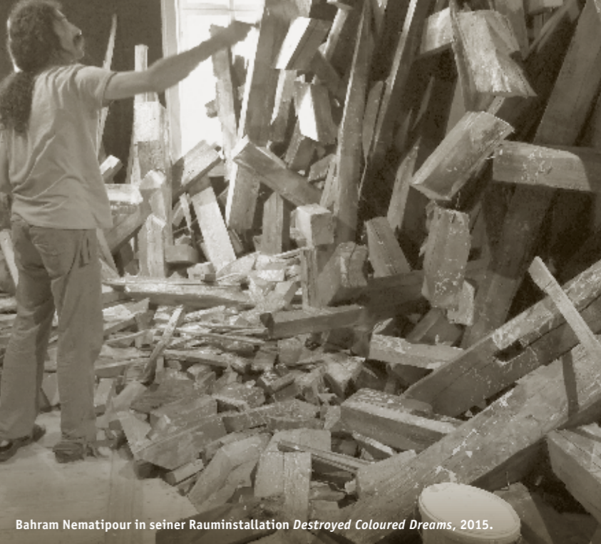
Bahram Nematipour in seiner Rauminstallation Destroyed Coloured Dreams, 2015.