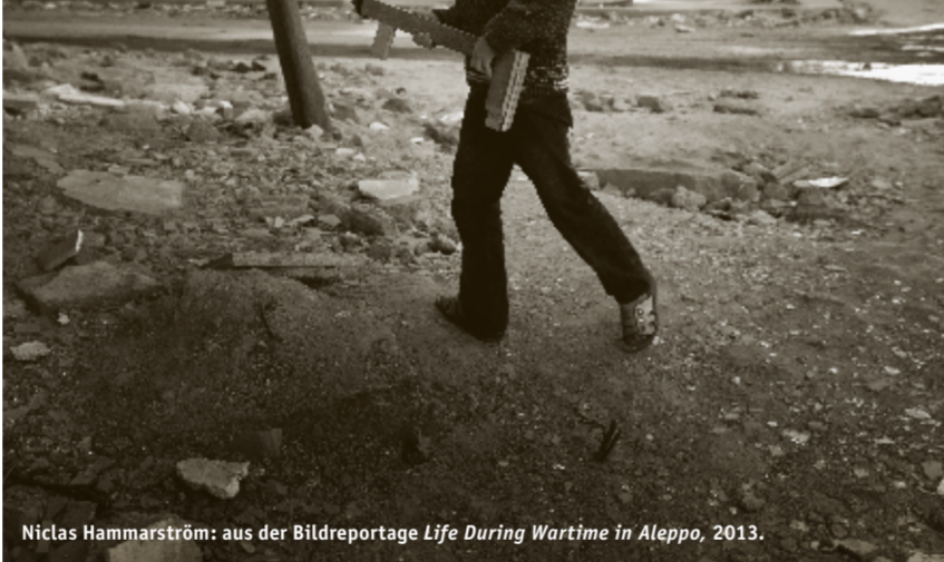
Niclas Hammarström: aus der Bildreportage Life During Wartime in Aleppo, 2013.