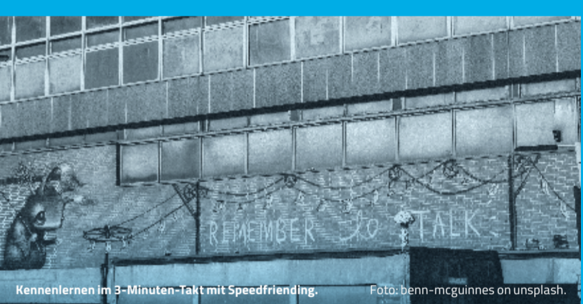
Kennenlernen im 3-Minuten-Takt mit Speedfriending.