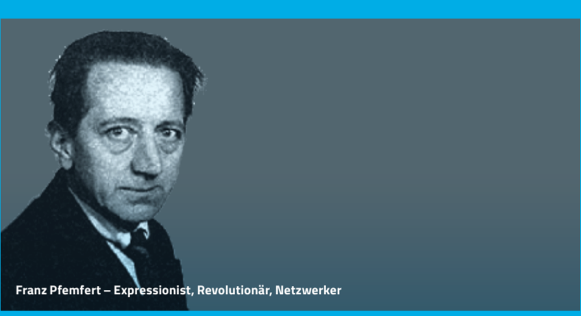
Franz Pfemfert – Expressionist, Revolutionär, Netzwerker

Das Jahr 1989 ist in der kollektiven Erinnerung leichter zu fassen als das darauf folgende, das sich schwer auf einen Nenner bringen lässt und meist im geschichtlichen Schatten seines Vorgängers steht. 1990 überschlagen sich die Ereignisse oder reißen unvermittelt ab. Das Gedächtnis fasst ein solches Jahr nur schwer. Die Publikation Das Jahr 1990 freilegen , das im Leipziger Verlag Spector Books 2019 erschienen ist, beschäftigt sich mit vielen unterschiedlichen Aspekten dieses Jahres. Es montiert Bilddokumente und Stimmen aus dem Jahr 1990 mit essayistischen Reflexionen und Geschichten (u. a. 32 Geschichten von Alexander Kluge), in denen aus der Perspektive der Gegenwart auf dieses Jahr zurückgeschaut wird. Mit herausgeber Jan Wenzel und Anne König sowie Anselm Graubner , dessen Fotos im Buch wie auch in der ACC-Schau Die Zeiten ändern sich (bis 12.7.) zu sehen sind, stellen das Buch vor. Eintritt frei!